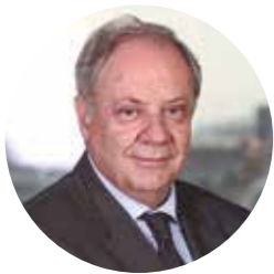
SANTIAGO DE TORRES

Está formado por personas de reconocida trayectoria profesional, con una gran capacidad de detectar los retos de la sociedad en relación con los fines fundacionales. Los patronos aportan la visión y la estrategia de la Fundación para avanzar hacia una sociedad más justa.